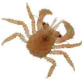
Рисунок 3. Ювенильная особь камчатского краба.

И вот подходящий субстрат найден. Глаукотэ прикрепляется к нему и даже практически утрачивает способность плавать. Проходит некоторое время — и глаукотэ линяет на первую ювенильную стадию (рисунок 3). Ювениль уже крепко стоит на шести лапах. Шести — потому что первая пара брюшных ног превращена в клешни и используется для захвата и обработки