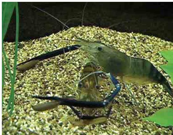
Рисунок 4. Самец гигантской пресноводной креветки ухаживает за самкой.

Но вернемся к поведению самца, самки и других обитателей гарема. Незадолго перед репродуктивной линькой самец начинает проявлять интерес к самке, преследует ее, постоянно находится рядом, отгоняет других креветок. После линьки самец остается рядом с практически беспомощной самкой и активно ухаживает за ней, что выражается в подъеме карапакса и тела, колебании антенн, подъеме и вытягивании второй пары переопод. Часто самец как будто обнимает самку, охватывая ее своими длинными клешневыми конечностями (рисунок 4), то и дело как будто успокаивающе поглаживает антеннами, чистит верхнюю часть головогруди переоподами. Все эти действия не характерны для обычного поведения, не связанного с размножением. Единственное, на что категорически не согласен самец — это отпустить от себя самку. Обращает на себя внимание также отсутствие агрессии самца к самке, часто проявляемой в обычном поведении. Ухаживая за самкой, самец не забывает бдительно охранять ее от посягательств других самцов, но самое главное — от других самок гарема, готовых растерзать соперницу. Благодаря такой защите, так